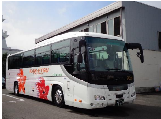
△使用する高速乗合バス

現在、羽田空港から群馬県内温泉地までの直行バスは無く、羽田空港第3ターミナルに直結する「羽田エアポートガーデン」から目的地まで乗換不要で到着でき、お客様の利便を増進することや新たな交流人口の創出を図ります。本高速乗合バスは、貸切ツアーバスと異なり最少催行人数の設定がないため、予約の有無に関わらず、毎日運行します。