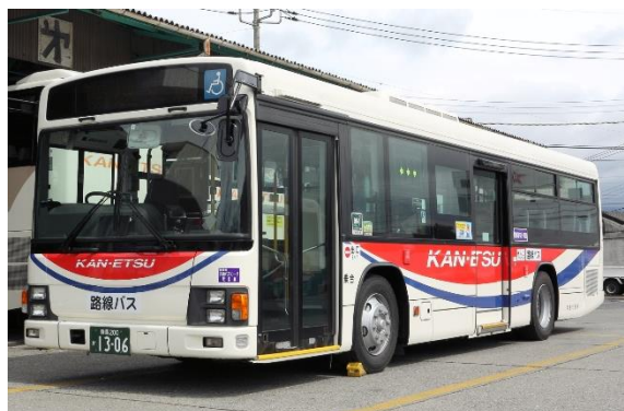
△使用する路線バス （イメージ）

「四万温泉バス2日フリー乗車券」は、関越交通路線バス中之条駅～四万温泉線（中之条駅～中之条ガーデンズ～四万温泉）と中之条駅～沢渡線（中之条駅～中之条ガーデンズ）が2日間乗り降り自由となり、四万温泉エリアの9施設でご利用いただける優待特典が付いた乗車券です。