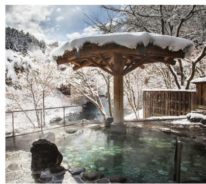
△四万清流の湯（イメージ） （一社）四万温泉協会

現在渋川・伊香保温泉フリー乗車券については路線バス車内で販売しておりますが、販売手続きに時間を要しお客様をお待たせしてしまうことや、キャッシュレス化が進む中で、支払い方法が現金のみということに課題を感じておりました。