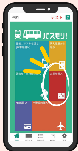
①定期券購入をタップ