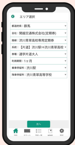
②各項目を選択 利用規約に同意