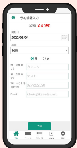
④利用開始日を選択 年齢・性別を入力