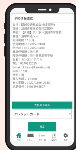
⑥予約情報を確認し、 支払い方法を選択 決済後チケットが 表示されます。