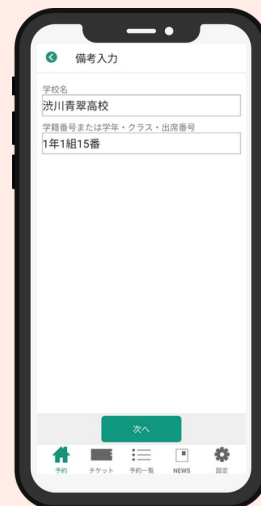
③学校名・学籍番号等を入力 (例) 高校生等の場合1年1組15番