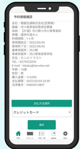
⑥予約情報を確認し、 支払い方法を選択 決済後チケットが 表示されます。