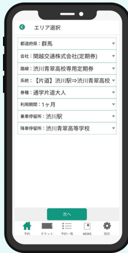
②各項目を選択 利用規約に同意