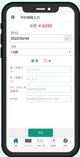
④利用開始日を選択 年齢・性別を入力