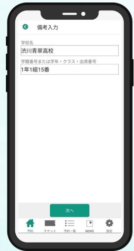
③学校名・学籍番号等を入力 例) 高校生等の場合1年1組15番