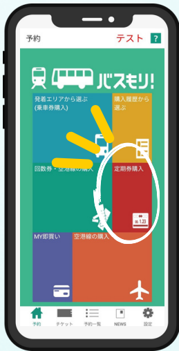
①定期券購入をタップ