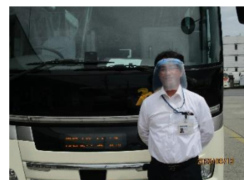
▲フェイスシールド