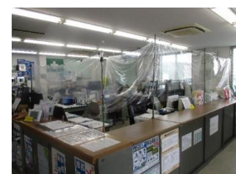
▲お客様窓口及び点呼場所における透明ビニールカーテンの設置