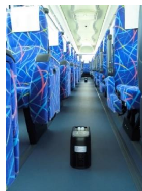
▲車両用クレベリン

日本バス協会 HP( http://www.bus.or.jp/covid-19/index.html )