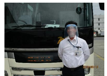
▲フェイスシールド