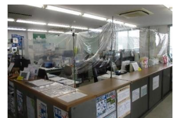
▲お客様窓口及び点呼場所における透明ビニールカーテンの設置