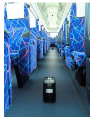
▲車両用クレベリン