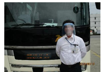
▲フェイスシールド