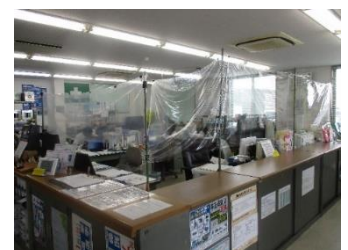
▲お客様窓口及び点呼場所における透明ビニールカーテンの設置