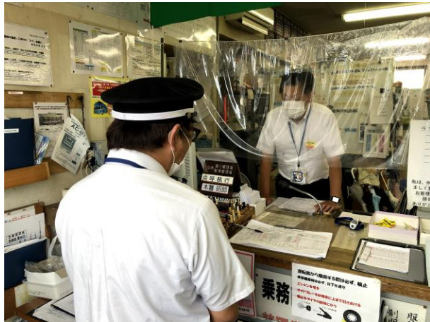
ソーシャルディスタンスに配慮した点呼