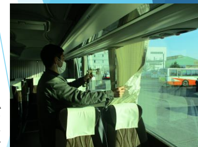
車内コーティング