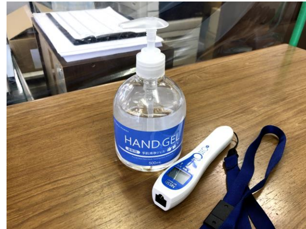
消毒液と非接触型体温計