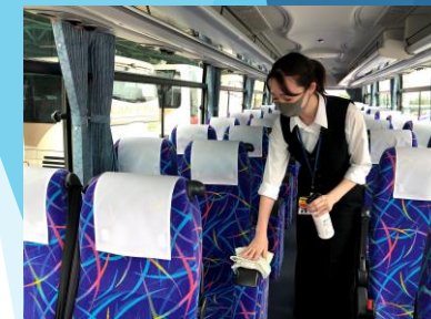
車内のふき取り消毒